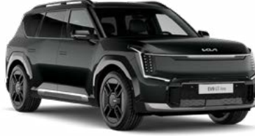
Aurora Pearl Siyah (ABP)