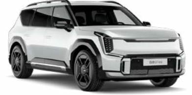
Snow Pearl Beyaz (SWP)