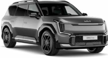
Pebble Gri (DFG)