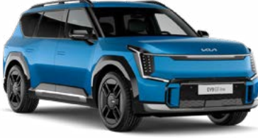
Ocean Mavi Metalik (OBG)