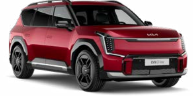
Flare Kırmızı (C7R)