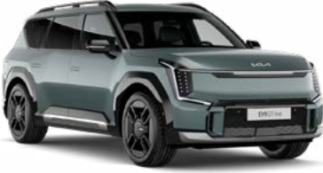
Iceberg Yeşil (IEG)