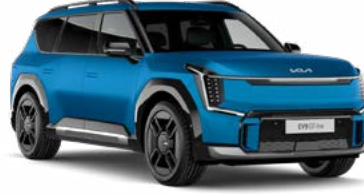
Ocean Mavi Mat (OBM)